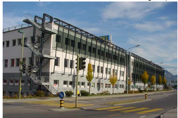
Abb. 21.6 Motel Stans NW, Kantonsstrassenseite (vorgehängte Glasfassade mit Sonnenschutzglas)