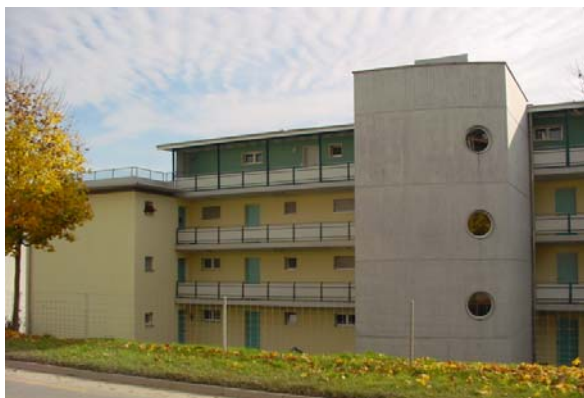
Abb. 21.3 Wohnhaus Rothenburgstrasse, Eschenbach LU (Laubengangkonzept)