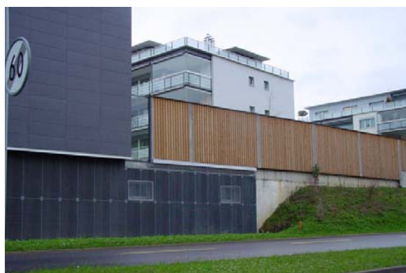
Abb. 21.44 dito, Holzlärm- und Schallschutzwand, Zwischenelement aus Glas, Sockelbereich absorbierend mit Gitterrost