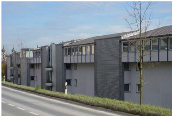
Abb. 21.1 Überbauung Rothenburgstrasse, Eschenbach LU (schallabsorbierende Fassade)