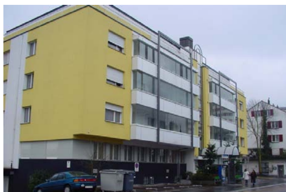
Abb. 21.36 Wohnhaus Spitalstrasse, Stadt Luzern (nachträgliche Verglasung Balkone)