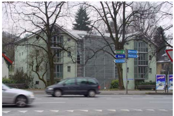
Abb. 21.55 Wohnhaus Taubenhausstrasse, Stadt Luzern