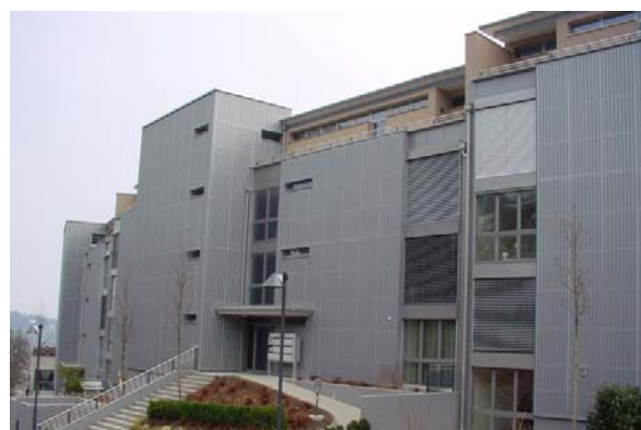
Abb. 21.24 Wohnüberbauung Unter Steinhof, Hergiswil NW (schallabsorbierende Fassade)