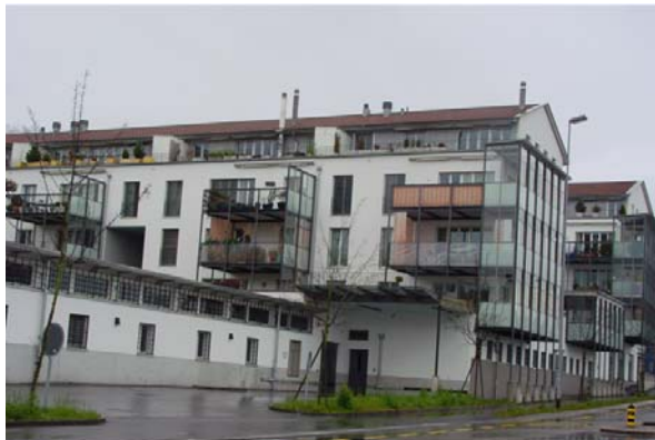
Abb. 21.49 Wohnüberbauung am linken Zürichseeufer