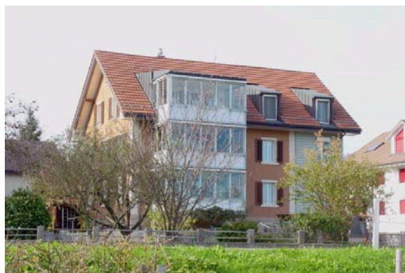
Abb. 21.15 Wohnhaus Hünenberg ZG (nachträgliche Konzeption verglaster Balkone; Wintergärten)