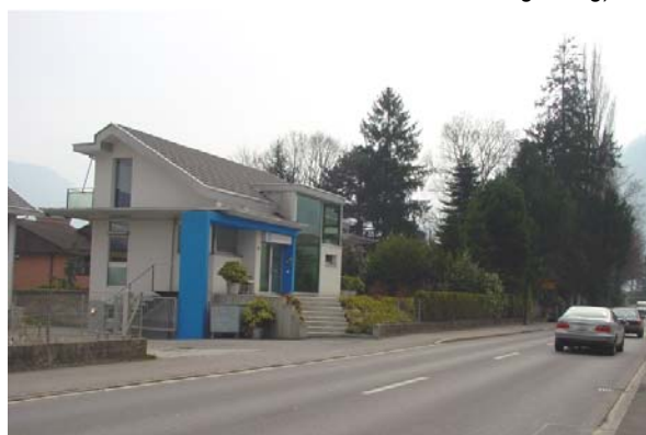
Abb. 21.28 Einfamilienhaus Hergiswil NW (Primärfenster lärmabgewandt, Zweitfenster seitlich)