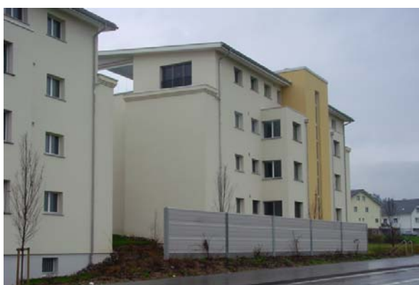
Abb. 21.34 Überbauung Baldeggerstrasse, Eschenbach LU