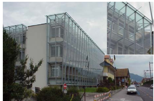
Abb. 21.8 Wohnhaus Spiez BE (vorgehängte Glasfassade)