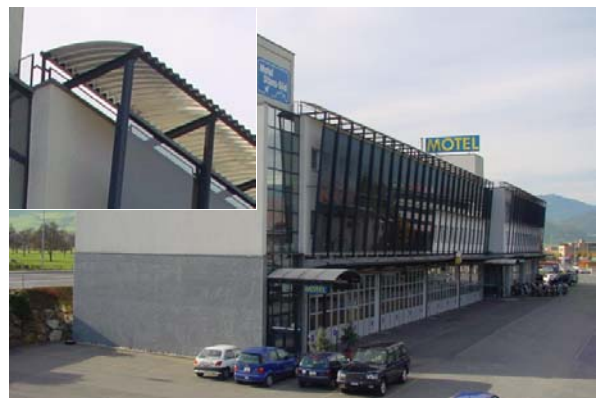
Abb. 21.7 dito, Nationalstrassenseite (Detail Witterungsschutz)