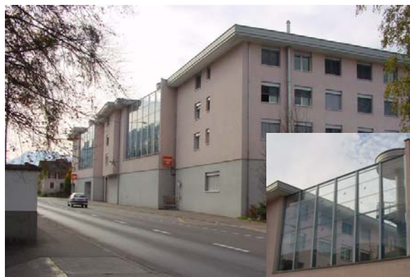
Abb. 21.13 Wohnüberbauung Root LU (quergestellte Gebäudekuben, verglaste Innenhöfe)