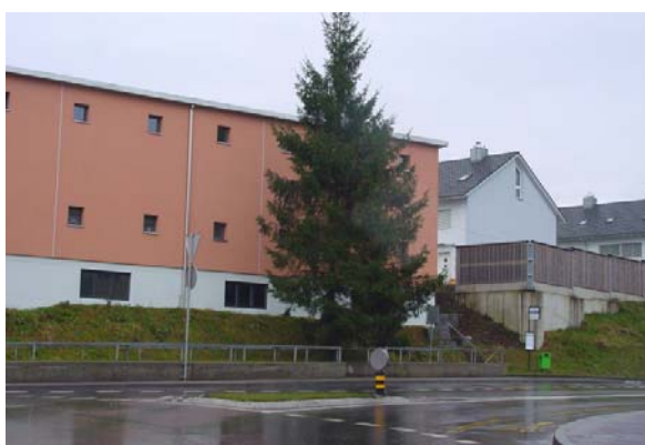
Abb. 21.38 Gewerbevorbau, Überbauung Kapf, Rothenburgstrasse, Emmen LU