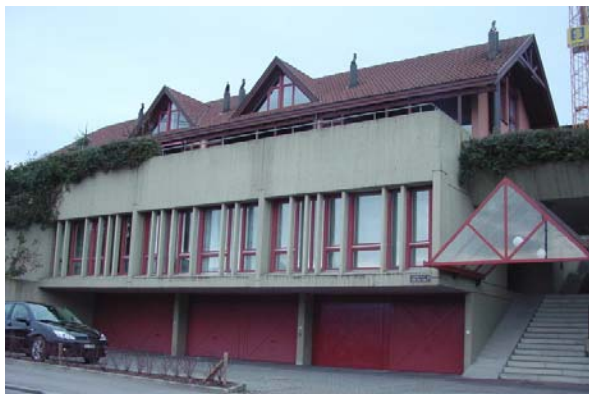
Abb. 21.41 Wohn- und Gewerbehaus Merlischachen SZ