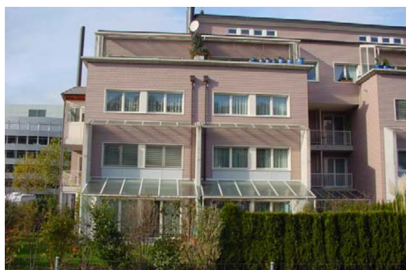
Abb. 21.20 dito (lärmpfindliche Räume konsequent lärmabgewandt orientiert)