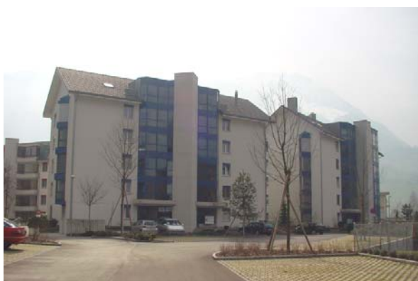
Abb. 21.26 Überbauung Spichermatt, Stans NW (lärmabgewandte Räume, Erkerkonstruktionen)