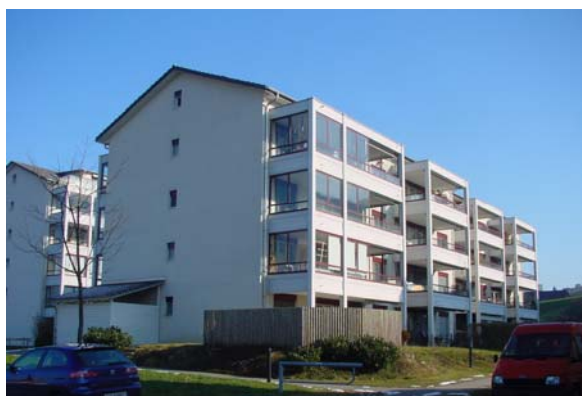
Abb. 21.39 Überbauung Littauerboden, Littau (LU)