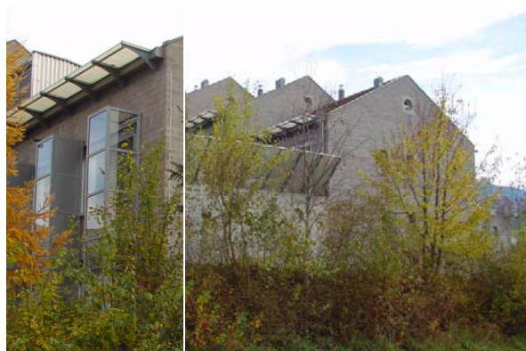
Abb. 21.17 Wohnüberbauung Gisikon LU (Winkelverglasungen, Lärmschutzwand zwischen Gebäuden)