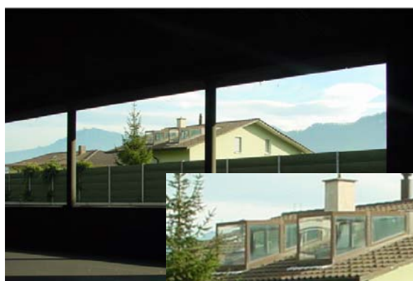
Abb. 21.40 Wohnhaus an Nationalstrasse A2 Hergiswil NW (nachträglich ausgebautes Dachgeschoss)