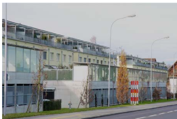
Abb. 21.16 Wohnüberbauung Hünenberg ZG (Vorplätze, Garagen, verglaste Unterstände, Terrassen)