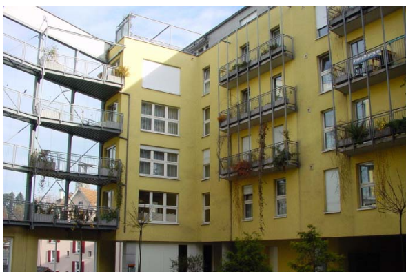
Abb. 21.12 dito, lärmberuhigter Innenhof