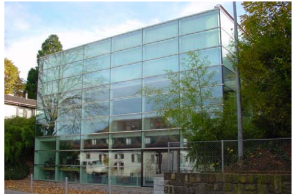
Abb. 21.5 Geschäftshaus Baltensweiler, Ebikon LU (Glasfassade, klimatisiert, Schallschutzgläser)