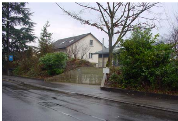
Abb. 21.37 Einfamilienhäuser Hünenbergstrasse, Stadt Luzern (Dämme, Flügelmauern, Einfahrtstore)