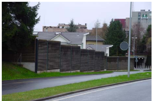
Abb. 21.47 Wohnhaus Bärtiswil, Rothenburg