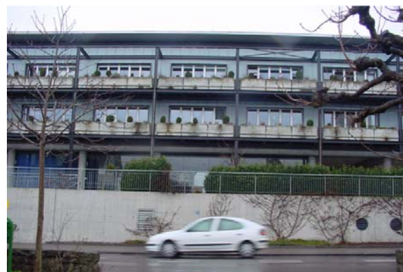
Abb. 21.31 Altersheim Sonnmatt, Hochdorf (vorgelagerte Blumentröge, schallabsorbierende Untersichten)