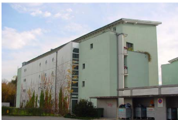
Abb. 21.25 Wohnhaus Seetalstrasse Emmen LU (konsequent lärmabgewandte Räume)