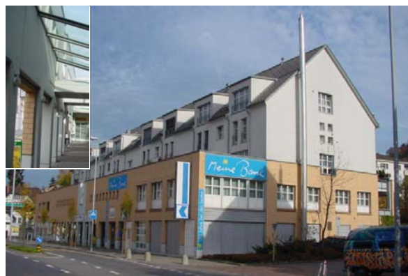
Abb. 21.14 Wohn-/Geschäftshaus Root LU (Gewerbevorbau, örtlich durch „Lärmschutzwand“ unterbrochen)