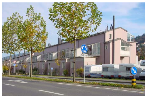
Abb. 21.19 Wohnüberbauung Ebikon LU (Erschliessungszone und Ateliers gegen Strasse hin konzipiert)