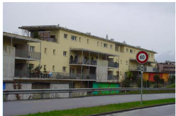
Abb. 21.46 Wohnüberbauung Küssnacht am Rigi SZ