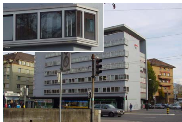
Abb. 21.23 Wohn- und Geschäftshaus Paulusplatz, Stadt Luzern (spezielles Kastenfenster 2-fach kippbar)