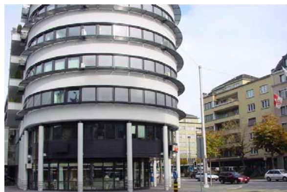
Abb. 21.21 Wohn- und Geschäftshaus Obergrund, Stadt Luzern (liegende Schallschirme; Wirkung ?)