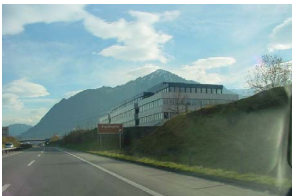
Abb. 21.27 Geschäftshaus Stans NW (nur Betriebsräume, Klimatisiert mit WRG, Schallschutzverglasung)