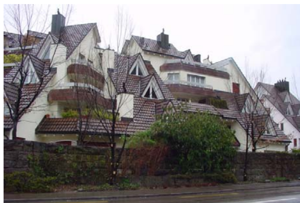
Abb. 21.52 Wohnüberbauung linkes Zürichseeufer (Bäch SZ)