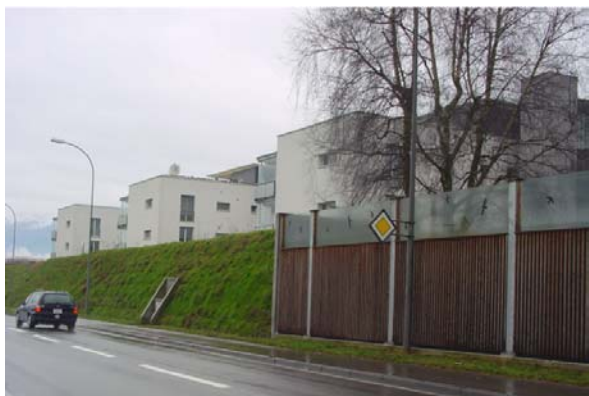
Abb. 21.35 Wohnüberbauung Eschenbach LU