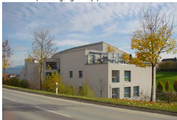
Abb. 21.4 Wohnhaus Rothenburgstrasse, Eschenbach LU (Terrasse mit Glaswand)