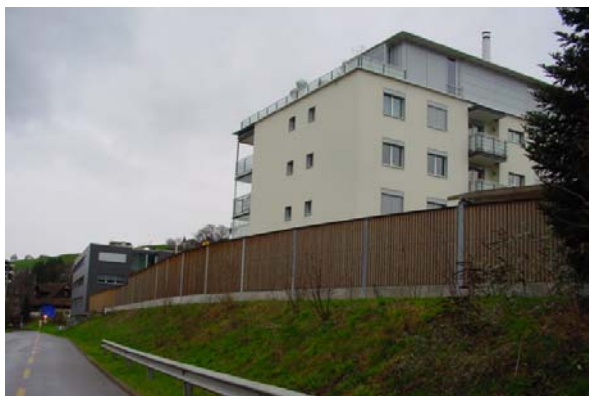
Abb. 21.43 Wohnüberbauung Küssnacht am Rigi SZ