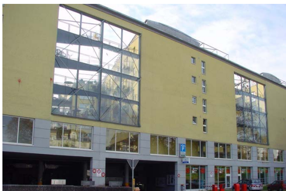
Abb. 21.11 Überbauung Schlossberg, Stadt Luzern (quergestellte Gebäudekuben, verglaster Innenhof)