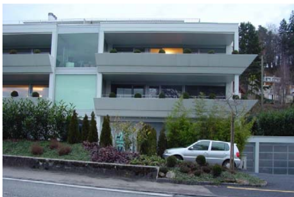
Abb. 21.42 Wohnhaus Obermeggen, Meggen LU