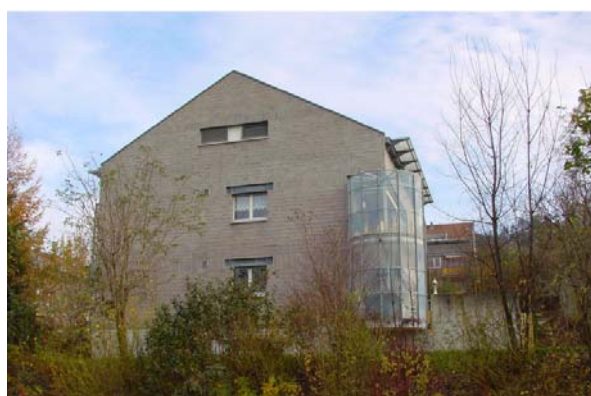
Abb. 21.18 dito, teilverglaste Balkone