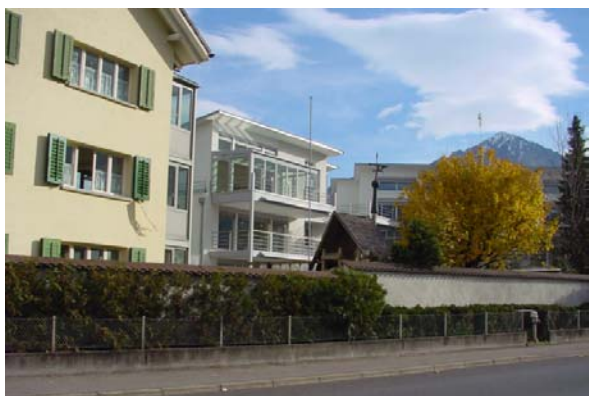
Abb. 21.10 Wohnhaus Stansstaderstrasse Stans NW (Wintergärten, kontrollierte Lüftung, Lärmschutzwand)