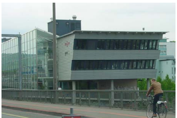
Abb. 21.56 Geschäftshaus, Basel