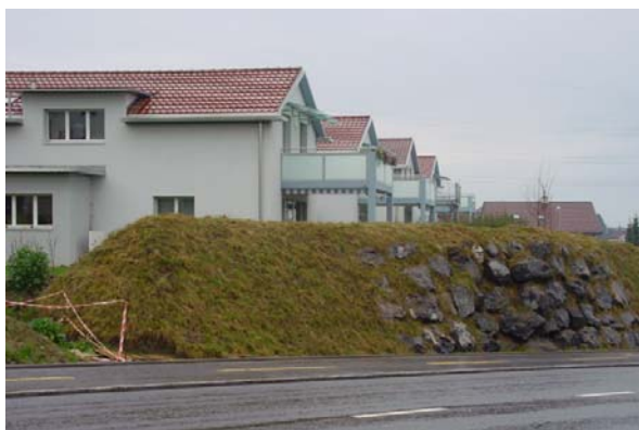
Abb. 21.33 Wohnhaus Bärtiswil, Rothenburg