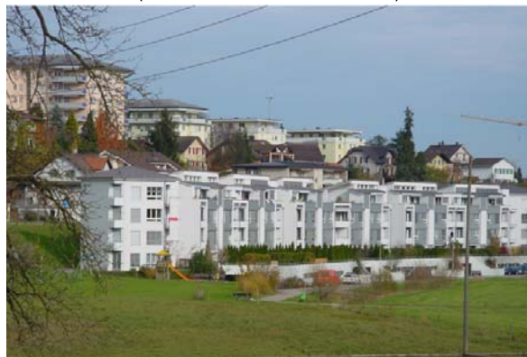
Abb. 21.2 dito, einseitige Orientierung gegen Süden, geschlossener Baukörper