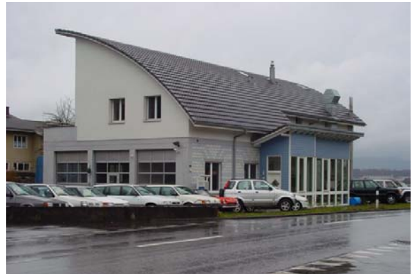
Abb. 21.53 Gewerbebau mit Wohnung (Dottikon AG)