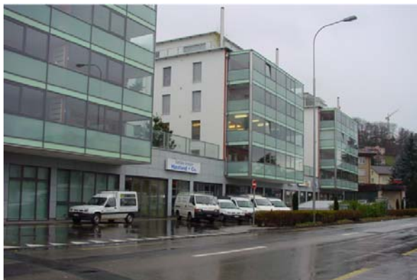
Abb. 21.51 Wohnüberbauung linkes Zürichseeufer