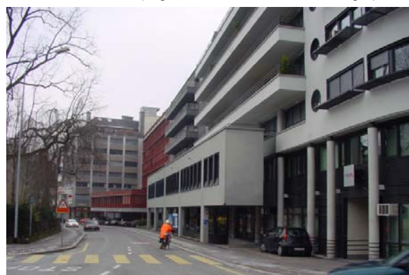
Abb. 21.22 dito; Wirkungsvoller Gewerbevorbau und Balkone