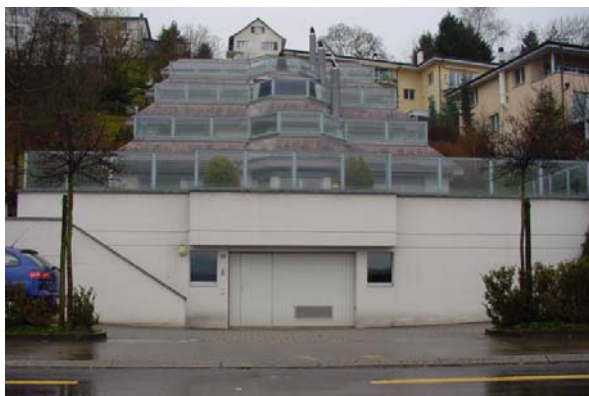
Abb. 21.50 Terrassenhaus Richterswil