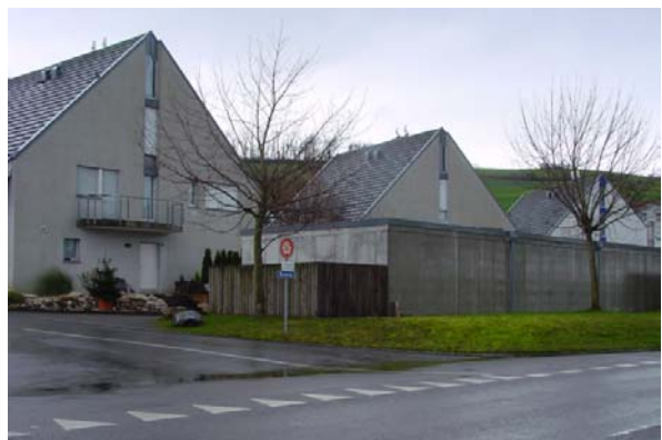
Abb. 21.54 Wohnüberbauung mit Garagenvorbauten (Sarmenstorf AG)