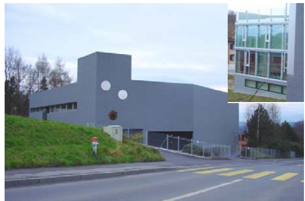
Abb. 21.45 Wohnhaus Kreuzbuch, Stadt Luzern (Winkelbau)