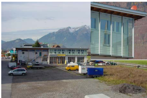
Abb. 21.9 Gewerbegebäude Rieden, Stans NW (vorgehängte Glasfassade bei Wohnung)